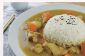
Curry de pollo