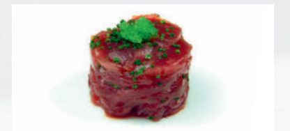
Tartar de Atún

Tartar de salmón 10,50€ Salmón preparado con salsa ponzu, cebollino y tobiko nori