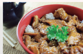
Arroz Teriyaki Don