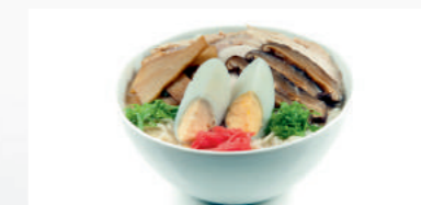
Sopa Miso Ramen

Misoshiru 4,10€ Sopa de soja con tofu, shiitake, wakame y cebolleta