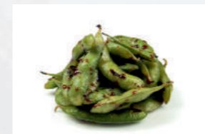
Edamame con jengibre

Berenjena con salsa Miso 7,50€ Berenjena, atún y almendras tostadas cocinados con salsa miso